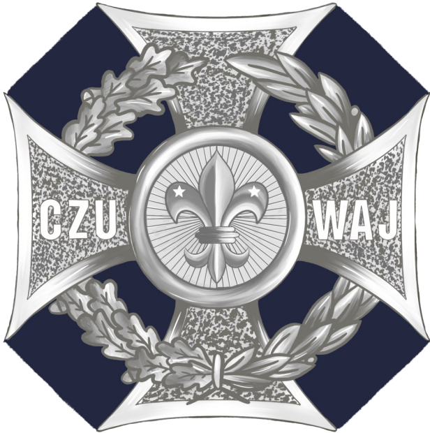
Granatowa podkładka pod krzyżem harcerskim grafika pwd. Patrycja Olek

Oznaką stopnia przewodnika jest granatowa podkładka pod krzyżem harcerskim i granatowa lilijka na lewym rękawie munduru.